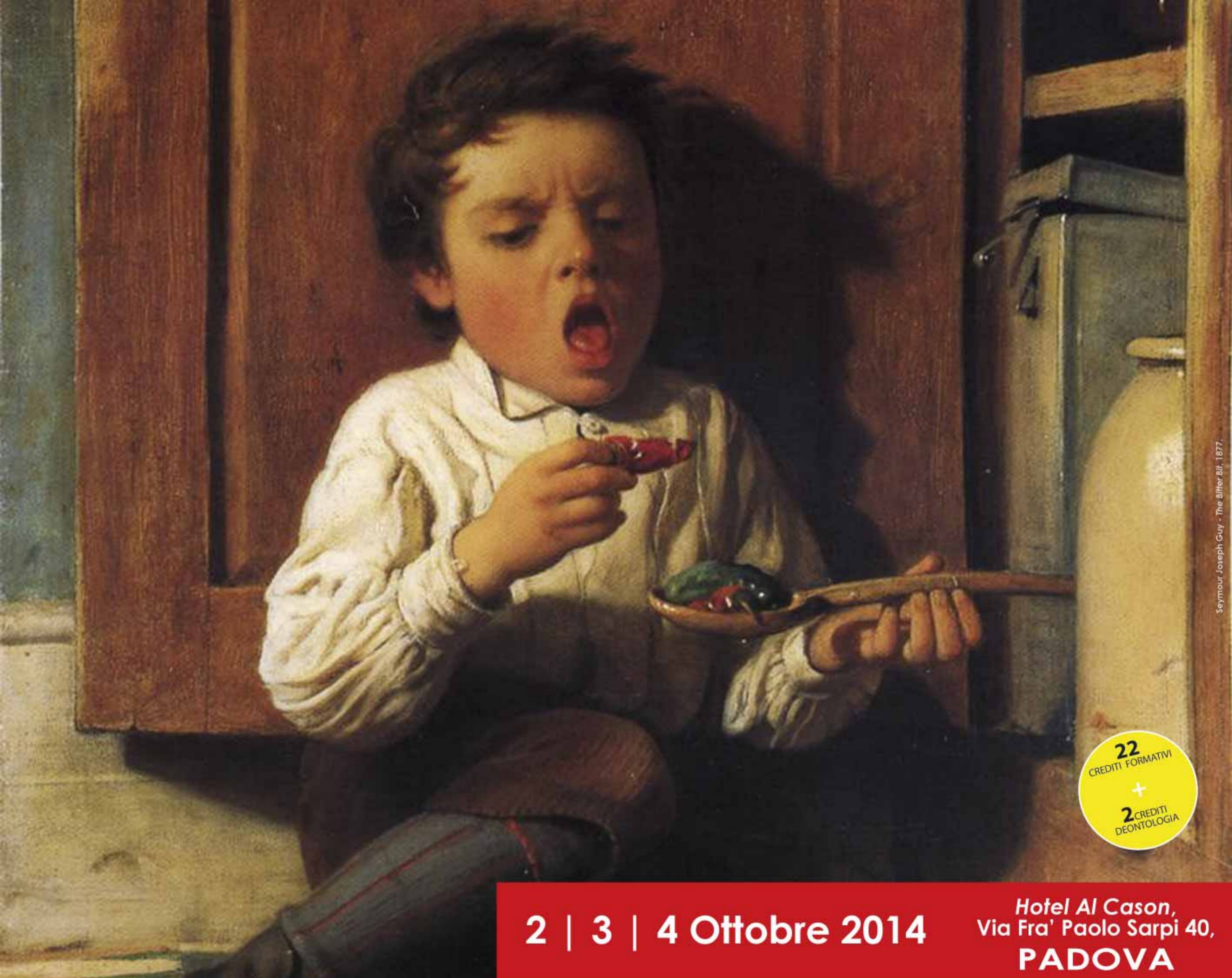
Seymour Joseph Guy - The Bitter Bill, 1877.

22 CREDITI FORMATIVI + 2 CREDITI DEONTOLOGIA